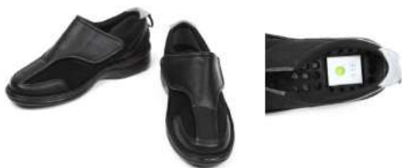
①マジックテープタイプ 料金：7,800円(税抜)

専用靴の中敷き内の収納スペースにGPS端末を入れて使用することができます。 GPSの持ち運びができない方も、外出時にGPSを携帯することができます。 靴の費用の補助はありません。