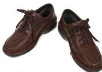
②紐靴タイプ 料金：9,800円(税抜)