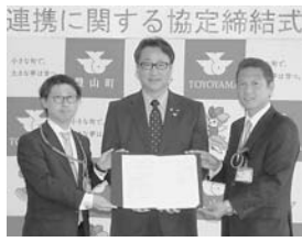
連携に関する協定締結式

つていく上で根幹を成すものです。住民説明会は、主に区域区分の見直し素案について町の考え方を説明し、素案に対するご意見をお伺いするものです ▼とき 十二月七日(木) 午後七時～ ▼ところ 役場二階 会議室一 ▼問合せ 地域振興課地域振興係 ☎28・2463