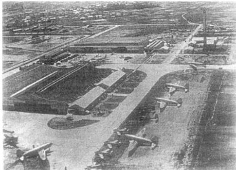
昭和30年頃の小牧飛行場

その頃、まだ基地内には戦中の陸軍の戦闘機（三式戦闘機「飛燕」）の掩体壕が五つ、六つ残っていた。昭和三十七年、戦後わが国初の開発機YS-11が、翌三十八年にはMU-2が、そしてその後S-62、T-2、F-1、MU-300、CCV研究機、F-2、MH-2000等々戦後の日本の新しい翼が、この小牧南工場で巣立ち名古屋空港から飛び立っていたのである。