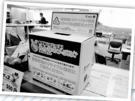
役場 1F 住民課 窓口に設置