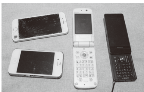
▲メダルがいくつできるかな

A 生活福祉部長 東京オリンピックピック・パラリンピック競技大会組織委員会が主催するこのプロジェクトは、県内10自治体がすでに回収を始めています。本町については、持続可能な循環型社会の実現を目指すプロ