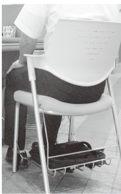
▲職員提案で荷物置き型イスに

Q 町長には堂々と風通しの良い職場風土を築いてほしい。そのため何を考えているか。