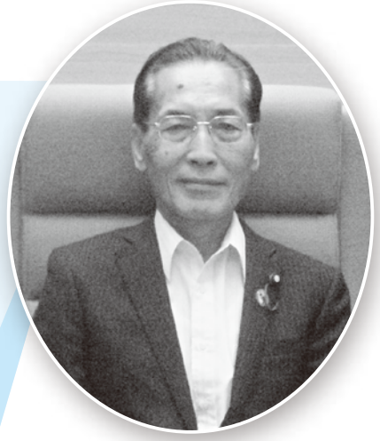
議長 水野 晃