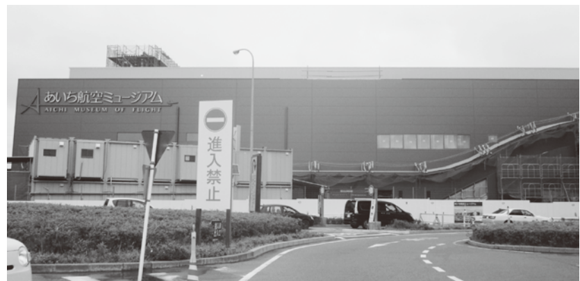
▲建設中のあいち航空ミュージアム

国の地方創生交付金により「豊山航空フィールドミュージアム構想」を策定。来町者、町外居住者へのアンケート、旅行者へのヒアリングとアンケートなどによる現状分析と課題整理を踏まえて、観光誘客の構想がまとまった。 詳しくは、町ホームページをご覧ください。