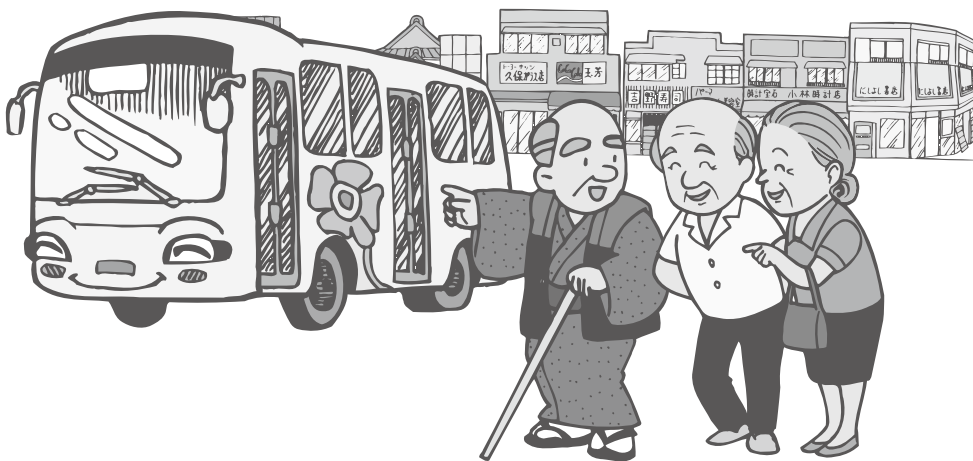
▲高齢者の足の確保を

地域交通の役割は一段 と重要になる。 高齢者や障害者を言 めたすべての住民の皆 様に対して、公共交通 のアクセスが向上する ように取り組む考えで ある。