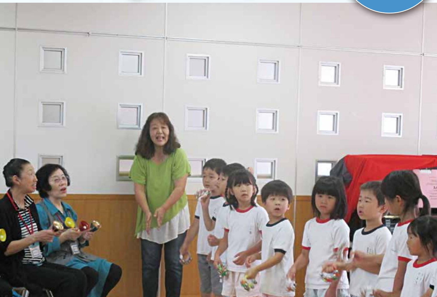
うたごえクラブ 青山保育園ホールにて