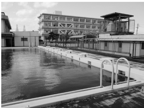
きれいになるよ 新栄小学校プール