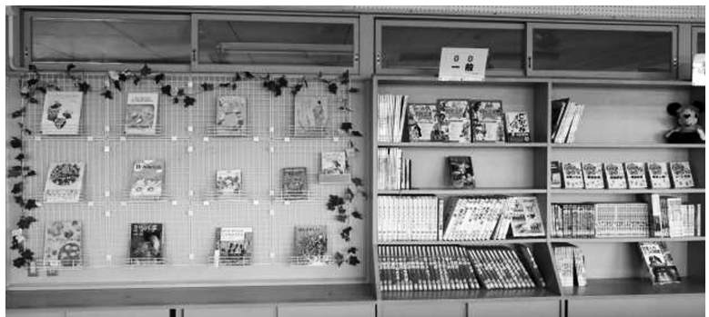
快適になるよ 志水小学校図書室