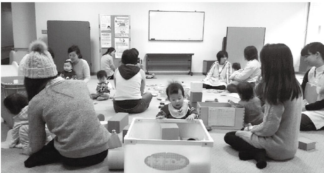
▲子どもにやさしい町づくり（保健センター 子ども健康相談）

お年寄りや子どもにやさしい「誰もが住みやすい、住み続けられる町づくり」に全身全霊を尽くして取り組む。