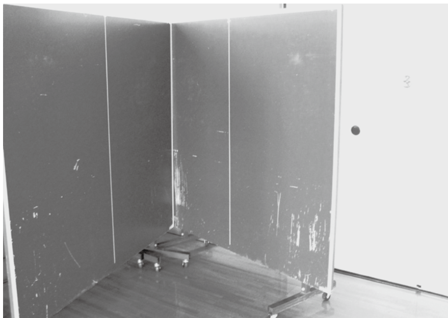
▲富士学習等供用施設の卓球台は更新が必要

また、管理運営等に問題が発生した場合には、随時打ち合わせ会議を行うことになっている。これらの会議以外にも、利用者からの要望や苦情を受けたり、大きな修繕事例が発生したりした場合には、その都度連絡をす