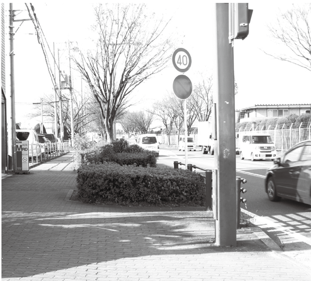
▲三菱重工前の歩道

れたものであり、歩道は1.5mである。 また、都市計画道路であり、改修の考えはない。