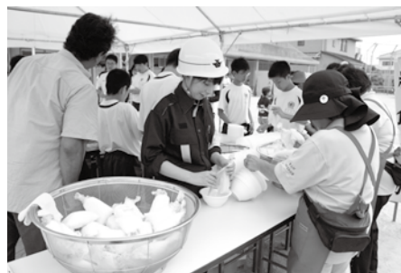
▲防災訓練に参加を