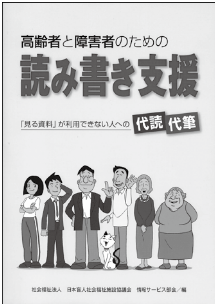
▲小牧市の講座のテキスト

高齢化の進展に伴い、視力の低下した高齢者など、読み書きに支障がある方への支援の必要性が高まってきている。