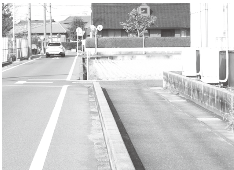
▲あぶない 急に狭くなっている

Q 登下校の安全指 導は。 A 教育次長 児童の安全を考 え、基本的に通学路を通 るよう指導している。 他に、交通標語の唱和、 通学路の点検、現地指導 の実施等で安全指導して いる。