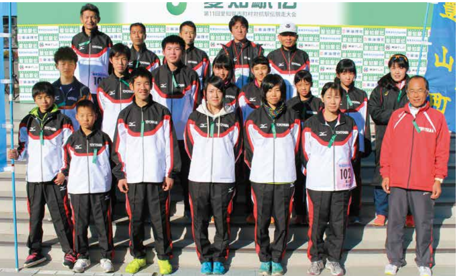
愛知駅伝 9位入賞おめでとう!!