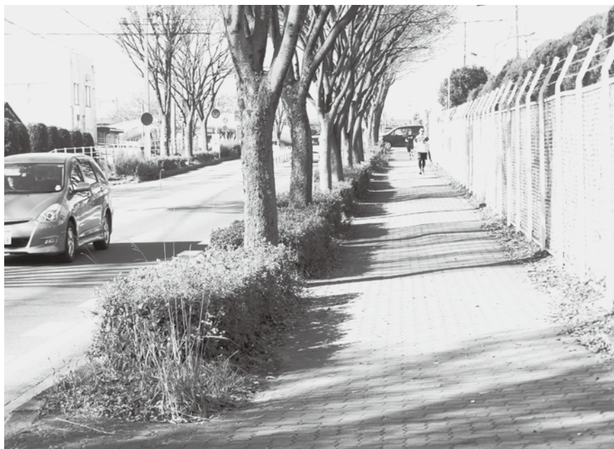
▲安全な歩道を望む