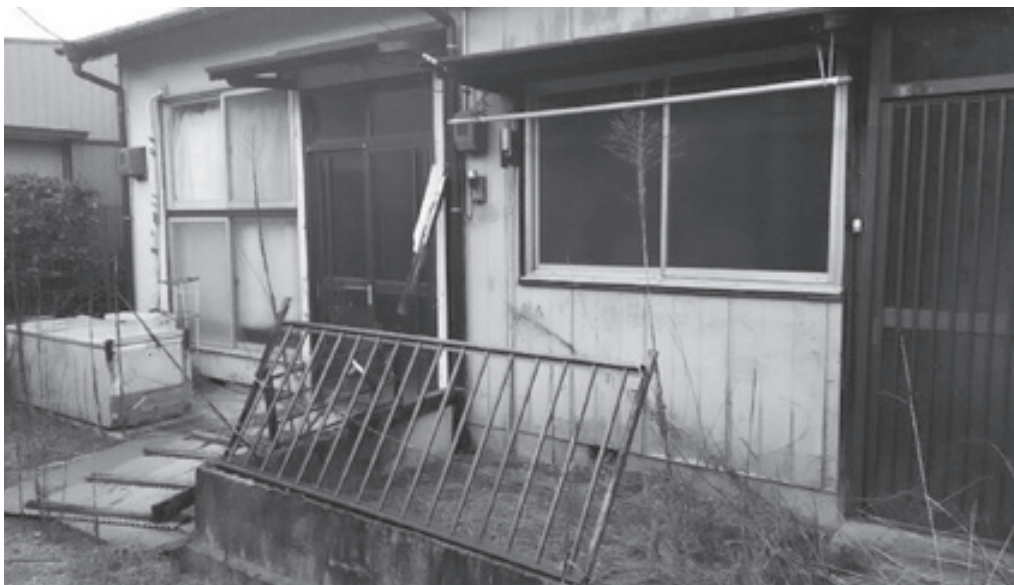
安全な対策をのぞむ

A 産業建設部長 人口が増加傾向にあること、航空産業の集積に伴い、該当する空家が見受けられないと認識している。調査をしたことはないし、今後も調査する必要はないと判断している。