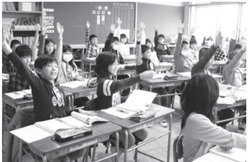
教育費も増額された