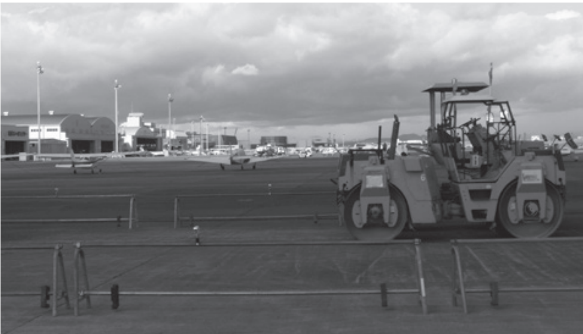
さまざまな役割が期待される名古屋空港

港全体をフィールドミュージアムとして活用するとされている。町としては、展示施設に町内外から多くの方に来ていただくよう、県や関係機関と連携を密にしている。