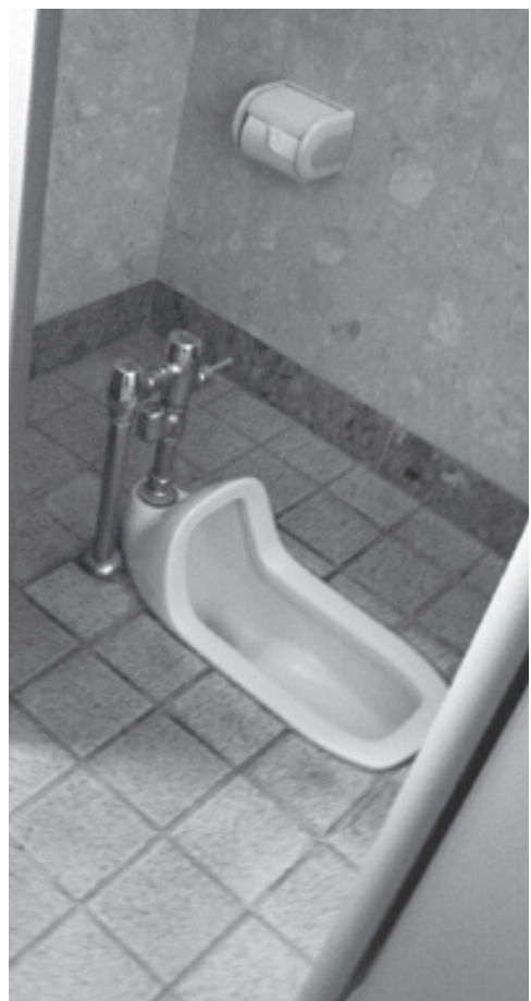
手すりがあると助かります

は、大事な配慮。新栄供用施設は、平成17年度に建築。16年度に県の条例が改正され、新たな基準に基づき、手すりを設置した。他の供用施設は、16年度以前の建築のため、設置されていない。