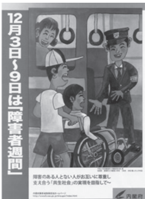
もっと理解を深めよう