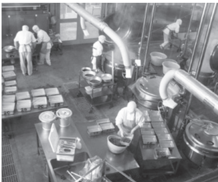
おいしい給食ありがとう

また、保育園だより、ホームページ、広報ケーブルテレビを通じて、食育情報をPRしていく。