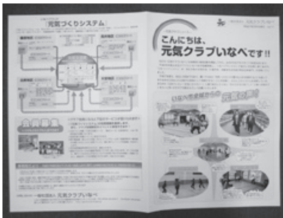
豊山でもやってほしいな

豊山町にもぜひ、取り入れてほしい。このシステムの導入マネージメントを活用してはどうか。