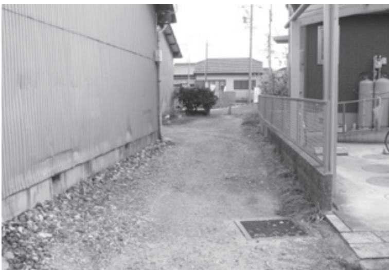
新しく認定された町道

財政調整基金（貯金）は、27年度当初の10億3061万1千円が、現在高8億9734万3千円と目減りした。