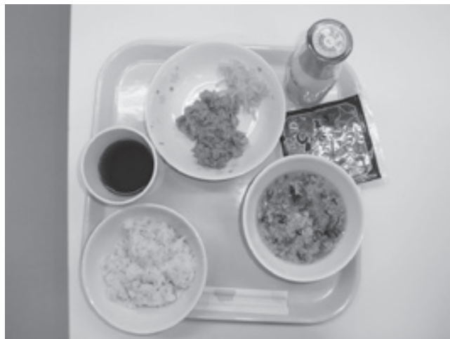
栄養を考えたメニュー