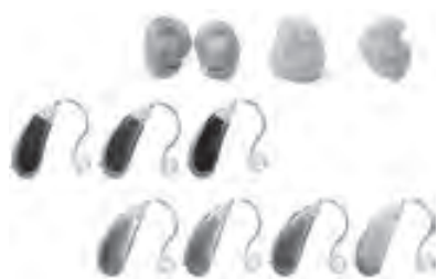
いろいろな補聴器