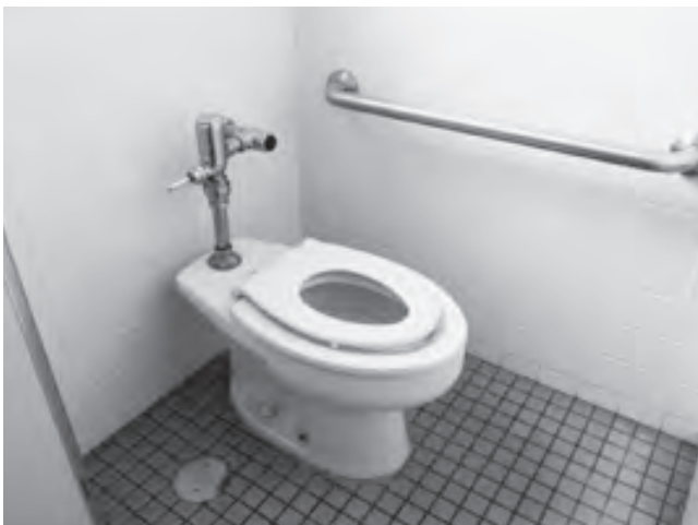
洋式トイレが増えるよ

町内の全てのコンビニエンスストア7店舗へのAEDの設置が完了し、その周知を図り、救急体制を整備した