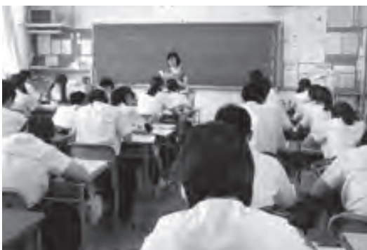
中学校の授業風景