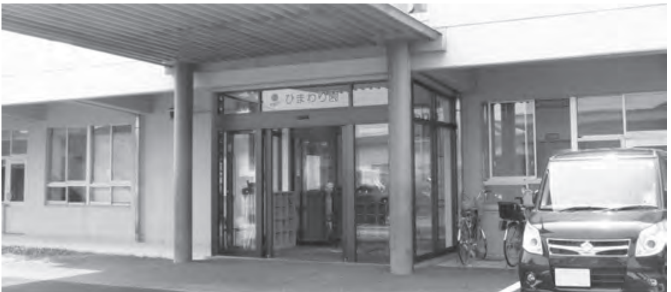
母子通園施設ひまわり園

「青い鳥」や「福祉の杜」などの関係機関との療育支援の体制をとっていることから、社会福祉士や臨床心理士の常駐は考えていない。