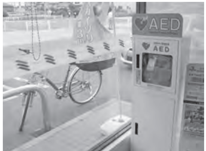
コンビニに設置されたAED