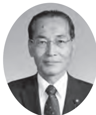
議長 水野 晃