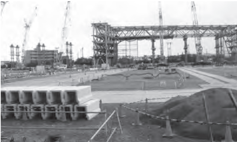
建設が進むMRJ組立て工場

Q 町長は「空港のあるまち」から「空港を活用するまち」への転換元年であると明言されている。今年5月の新聞紙面に、名古屋空港見学者受入拠点整備及び空港 中央線4車線化計画を県が発表した。当町も航空宇宙産業への対応や観光開発等に重点を置き、将来を見据えた環境整備をアグレッシブに行うべきと考えるが。