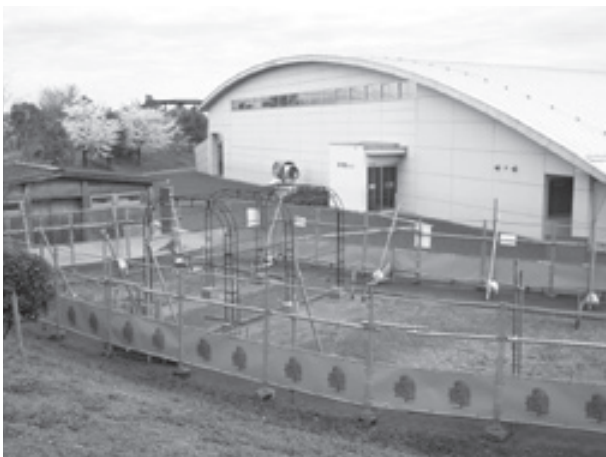
バラが咲いたら見に来てね バラ園工事中