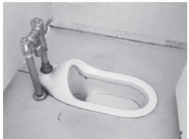
洋式トイレになるよ