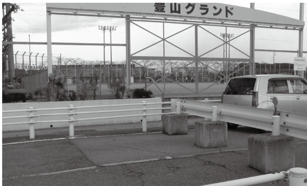
利活用方策が検討されている

なお、基本コンセプトは、交通安全対策、グラウンド利用との調和、景観への配慮、治水対策と