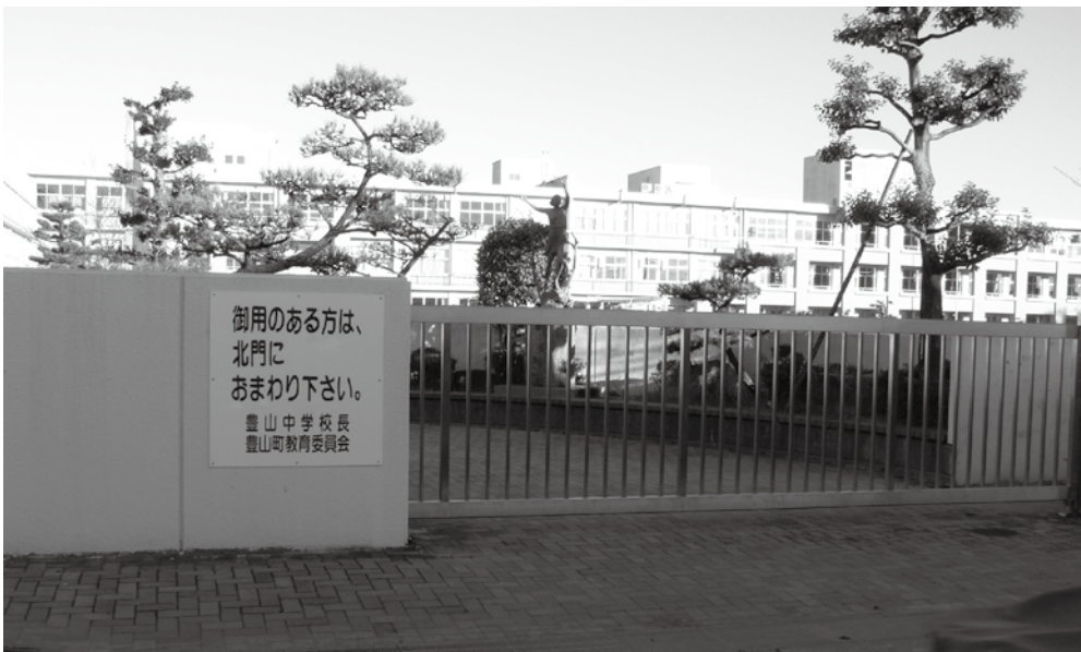
校訓「創造・責任・健康」

体的に使える時間を増や し、ゆとりの中で学校・ 家庭・地域が連携しつづ 社会体験や自然体験など 経験させ、みずから学び 考える力や豊かな人間性 など「生きる力」を育む ことである。 本町では、それぞれの 趣旨をよく理解し、研究 を進める。