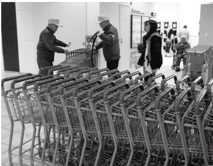
生き生きと働くシルバー人材センターの皆さん

したがって、具体的 な設置計画、設置場所、予 算額等については、3月 議会には審議いただける よう準備している。