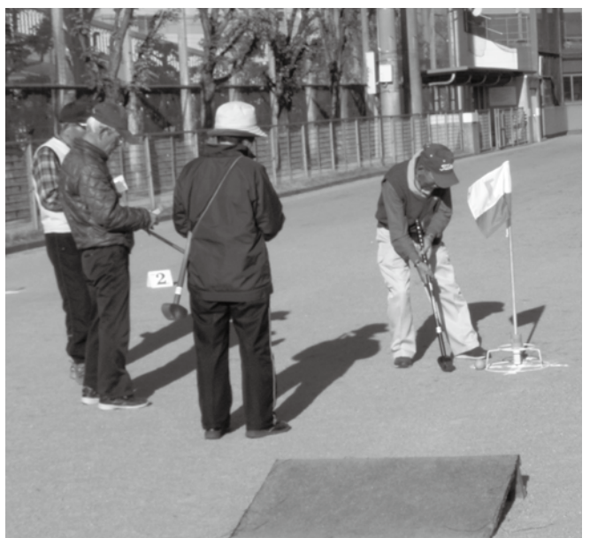
はつらつとグラウンドゴルフを楽しむ

Q 「豊山町生涯学習のまちづくり基本構想・基本計画」は平成22年3月に今後10年間を見通して策定された。進捗状況、評価体制、問題点は。