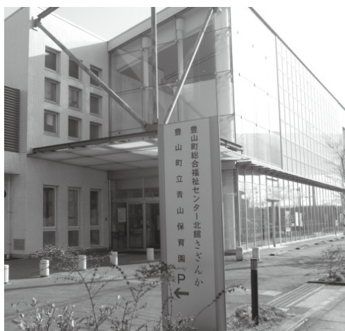
指定管理者制度導入をする青山保育園とさざんか

効果的であることが分かった。全小中学校への設置に向けて前向きに検討していく。保育園や公共施設への設置は、まず学校優先で、その後検討していく。