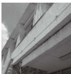
日進市北小学校のミストシャワー