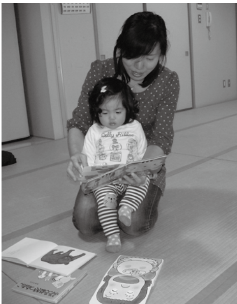
読み聞かせは愛情体験です

開かれた学校作り、地域との協働は順当な手段である。しかし、規模が小さい学校でたくさん人間はいらぬが、今後ボランティアの必要が考えられれば、考慮したい。