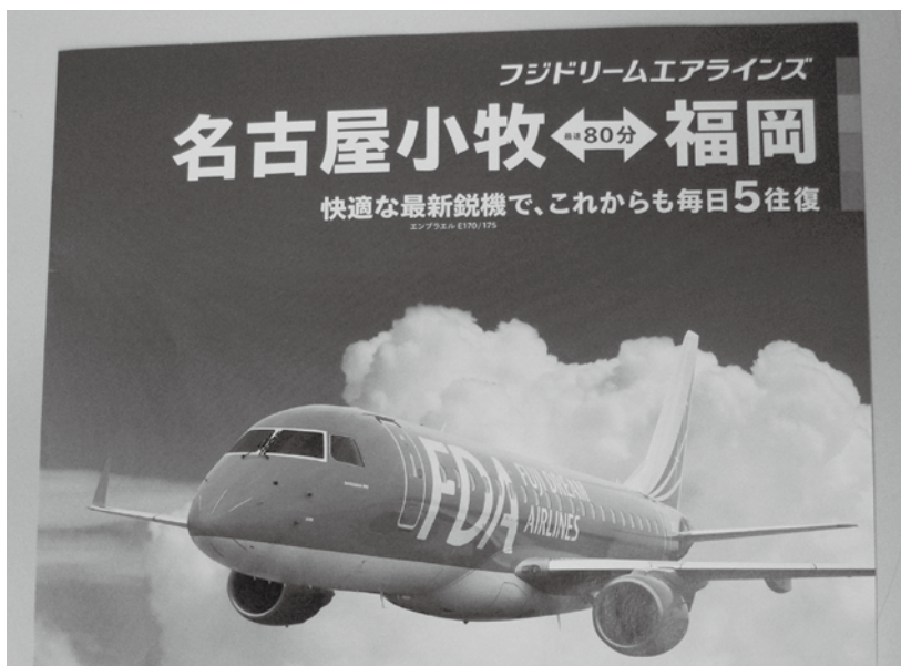
名古屋小牧と表示されているポスター