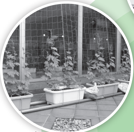
役場でも緑のカーテン