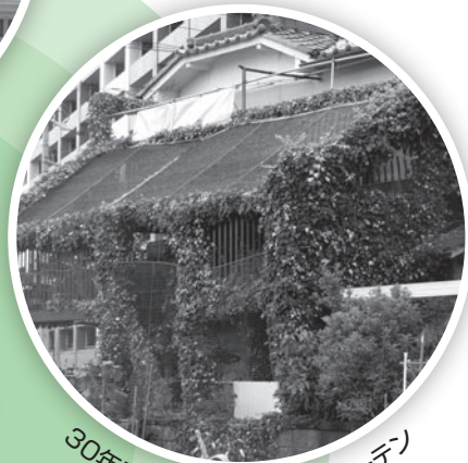
30年エアコン不用の緑のカーテン