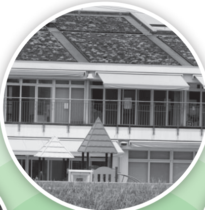
さざんかの屋上緑化

日本各地で省エネの取り組みが広がっている。東日本大震災で原発が止まり、東北、東京、中部、北陸で電力不足が心配されている。このため、家庭と企業は15%の節電努力を迫られている。そこで、町内の節電事情アレコレを紹介する。