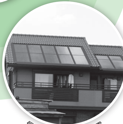
個人の家庭でも太陽光発電