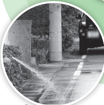
井戸水を利用して散水中