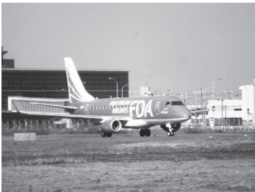
FDAと共に空港活性化を