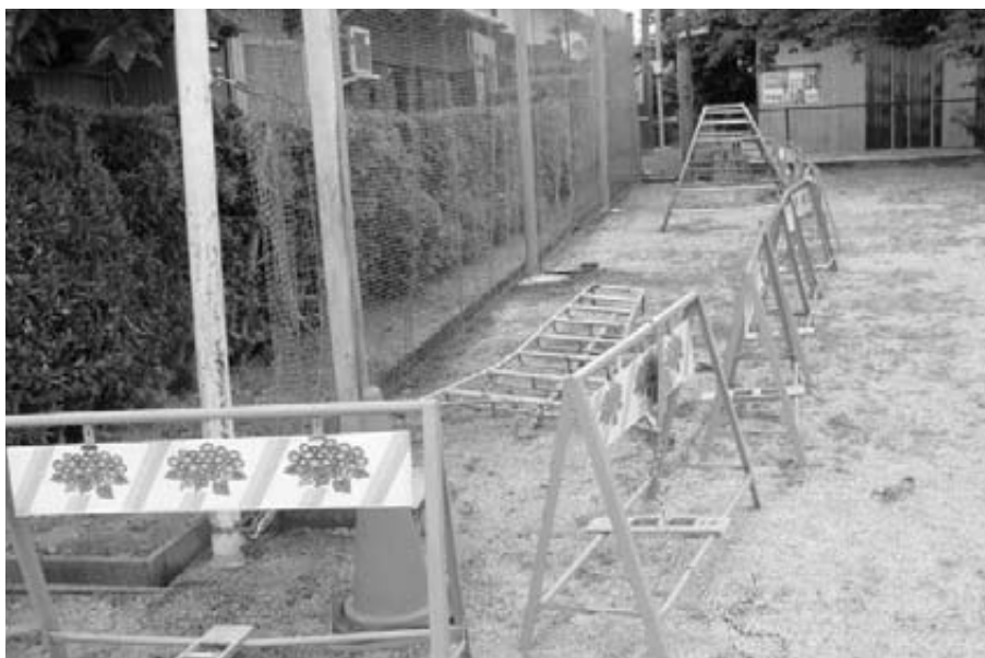
はやく遊べるように