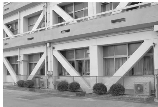
新栄小学校耐震工事