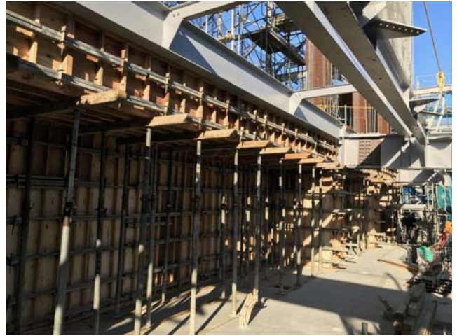
3 階立上躯体工事（平成 31 年 1 月 18 日）