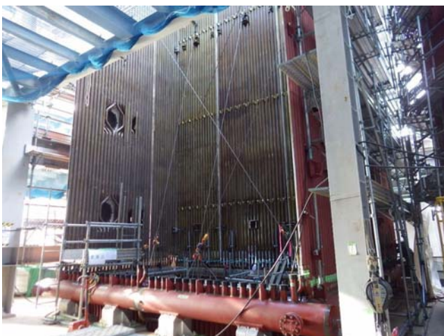
1 号ボイラ据付（平成 31 年 1 月 18 日）