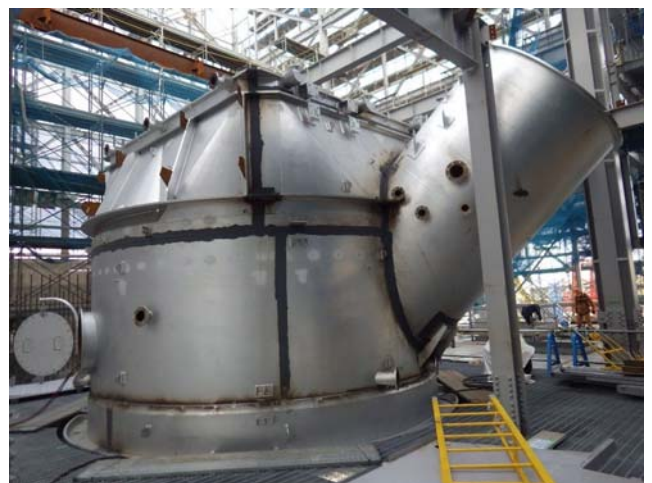
2 号熔融炉据付（平成 31 年 1 月 17 日）