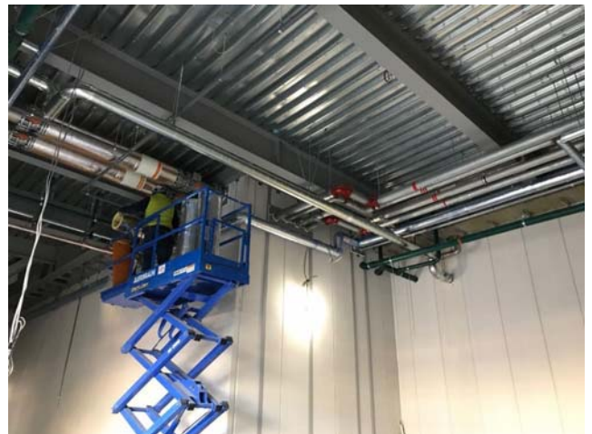
1 階建築設備配管工事（平成 31 年 1 月 18 日）