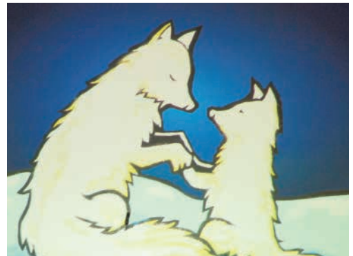
※内容は変更する場合がございます