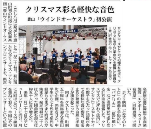
R 3.12.26 中日新聞近郊版

昨年8月に発足した豊山ウインドオーケストラのプレコンサートとなるクリスマス・アンサンブルコンサートが令和3年12月25日（土）エアポートウォーク名古屋で開催されました。