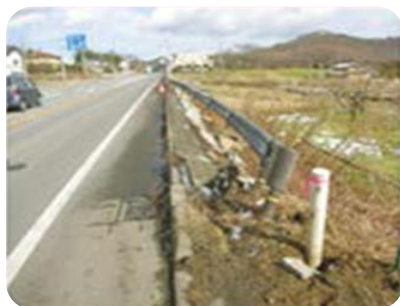
ガードレール・ 標識等の損傷