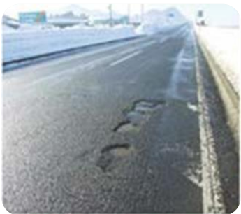
路面の穴ぼこ・ 段差