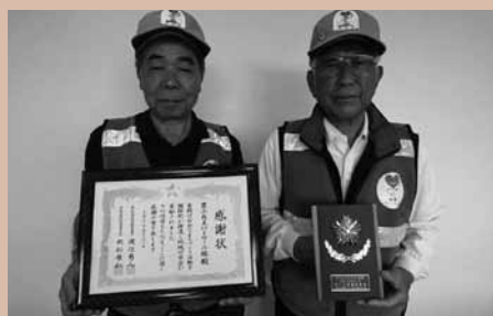
問合せ 防災安全課防災安全係 ☎28・0355

本町からは、日頃から防犯パトロールなど地域安全活動を積極的に行っている豊山自主パトロール隊が防犯団体功労賞を受賞しました。