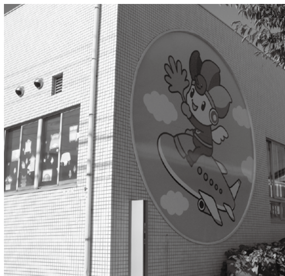
▲園児を迎えてくれる地空人くん