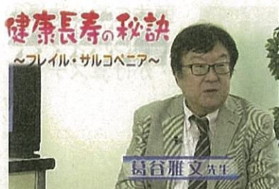
健康長寿の秘訣 ～フレイル・サルコペニア～