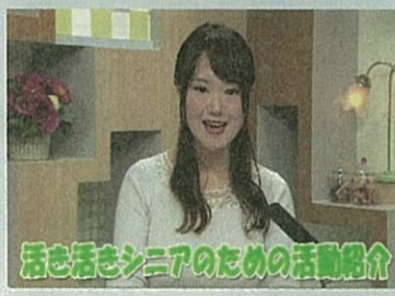
生き生きシニアのための活動紹介