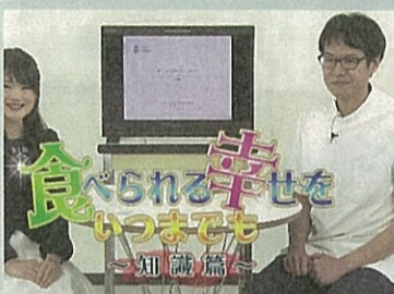
食べられる幸せをいつまでも ～知識編～