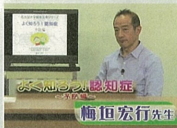
よく知ろう! 認知症③ ～予防編～