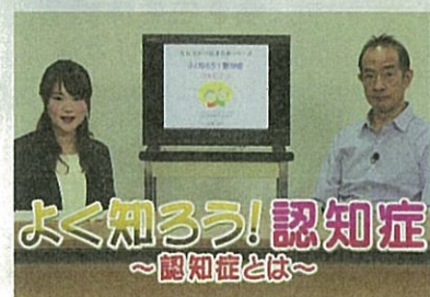
よく知ろう! 認知症 ① ～認知症とは～