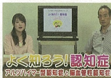
よく知ろう! 認知症② アルツハイマー型認知症と脳血管性認知症