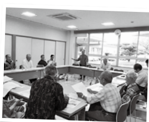
伊勢山地区古今歴史を語る会