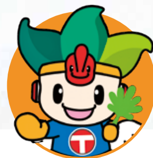
ちくじん 地空人くん

2月12日(水)、町内の建設会社3社と北名古屋市建設業協会のご協力により、保育園児に雪のプレゼントがありました。めったにさわれない雪に、歓声を上げていました。