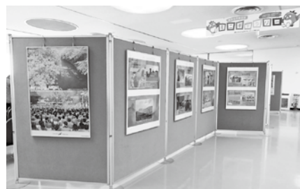
写真は 昨年のものです。