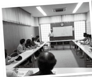
健康数珠つなぎの会