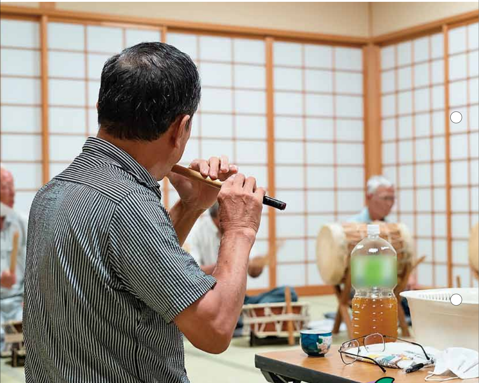
8月6日(木)、神楽保存会の練習会にお邪魔しました。 神楽保存会は豊山町の神楽を若い世代に伝承する活動をしています。