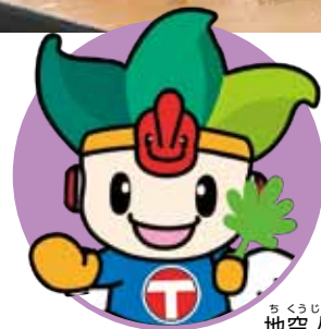
ちくろじん 地空人くん

P10 キラリ健康ナビ / P12 子育てひろば / P16 まなびすと / P18 わいわいプラザ