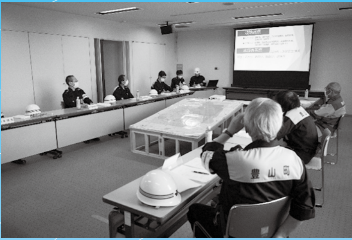
▲災害対策本部を設置

新型コロナウイルス感染症対策を講じた総合防災訓練が9月6日に行われました。 町長以下36人、消防団員は団長以下17人、小学校区自主防災会は各役員5人から10人と参加者を絞り実施しました。