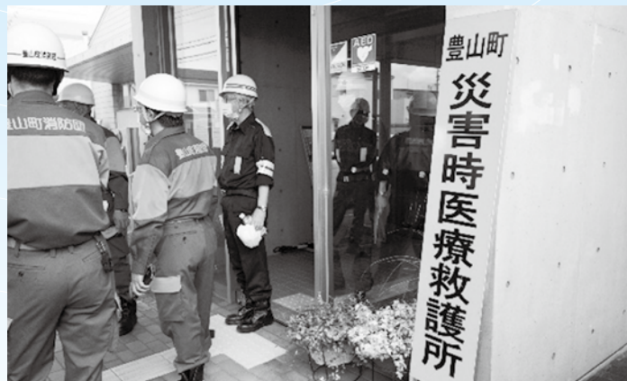
▲新栄供用施設に応急医療救護所を開設

災害対策本部からの指示により、新型コロナウイルス感染症の対策を講じた応急医療救護所を開設し、施設内のレイアウトや職員対応などを検証しました。