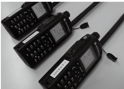
▲更新された移動系防災行政無線