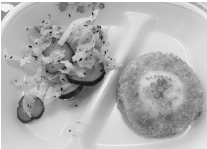
▲地空人くんコロッケ