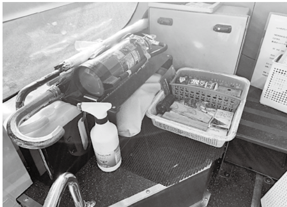
車内に手指消毒ボトルを設置

町は公共交通崩壊を食い止めるための緊急アピールを宣言しました。 安心して公共交通機関を利用していただくために、各交通機関が行っている感染症対策の取り組みをご紹介します。