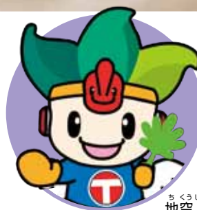
ちくぜんくん 地空人くん

問合せ 産業・都市政策課産業・観光係 ☎28-0944 豊山町商工会☎28-3800