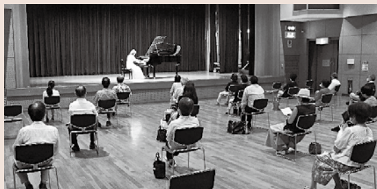
「前回コンサートの様子」