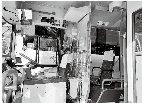
ビニール製のカーテンを設置