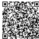
成人式のウェブサイトはこちらから