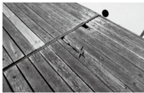
工事予定のウッドデッキ