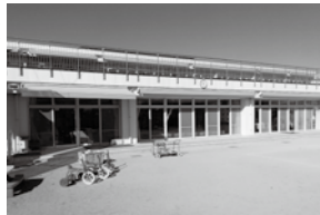
総合福祉センター北館さざんか

◎ 10018万6千円の工事内容は、 ▲ 2階テラスのウッドデッキの修繕を行う。デッキ下部の清掃、破損部分の取替え、表面の研磨加工、加工部分の塗装を順次行う。