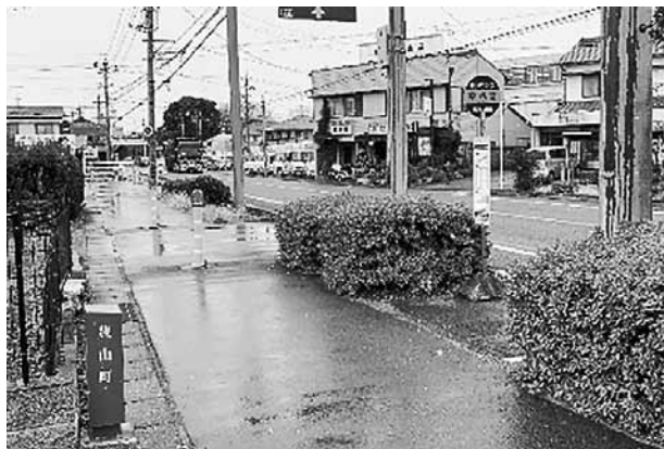
幸田・勝川線 (県営名古屋空港行き) バス停設置予定場所