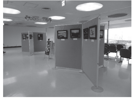
写真は一昨年のものです。

※今後の状況によりイベントの変更・中止の可能性があるため、ミニギャラリーの最新の情報は、名古屋空港ホームページをご確認ください。