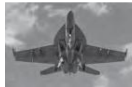
最優秀賞 「着陸態勢」