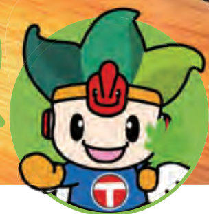
ちくうじん 地空人くん

4月25日(日)、消防団入退団式が行われ、新たに2名の方が消防団の一員となりました。