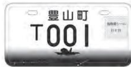
〈デザインサンプル〉