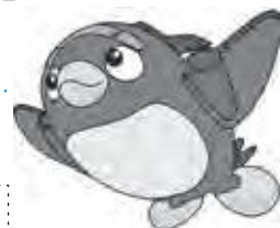
県営名古屋空港 マスコットキャラクター なごびよん

▶問合せ 名古屋空港総合案内所 ☎28・5633 ▶駐車場に関する問合せ 県営名古屋空港管理事務所 ☎29・1600