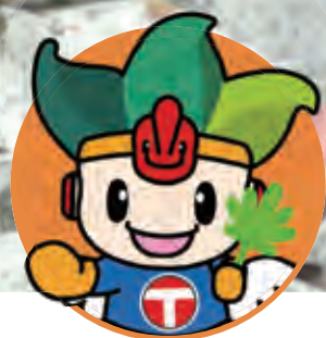
ちくじん 地空人くん

6月2日(水)、さざんか児童館でLet's Try が行われました。 たいそうやうんどろあそびなどをして楽しく体を動かしました。