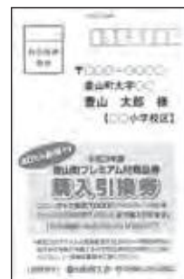
ハガキのイメージ