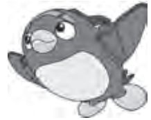
県営名古屋空港 マスコットキャラクター なごびよん

※今後の状況によりイベントの変更・中止の可能性があるため、最新の情報は、名古屋空港ホームページをご確認ください。(https://nagoya-airport.jp/)