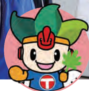
ちくうじん 地空人くん