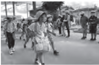
目を見て、しっかりあいさつ

新栄小学校では、これまでも「オアシス運動」を行っていましたが、コロナの影響もあり大きな声であいさつができなくなっていました。この状況の中でも学校をよりよくしていくと、児童会を中心にスローガンを決め、新たな「オアシス運動」を企画しました。 新しい取り組みとして、相手の顔をしっかりと見てあいさつすることや、「ありがとうカード」、「すてきな友だちカード」を書くことをはじめました。カードはクラスごとに集めて、大きな「ありがとうの木」に貼って掲示しました。 また、「スーパー新栄っこプロジェクト」として、オアシス運動の取り組みが活発になるようにスタンプカードを取り入れたり、動画で活動の紹介をしたりしました。 コロナによる制限のある生活がいつまで続くか先は見えませんが、創意工夫によってこれからもよりよい学校生活を送ってほしいと思います。