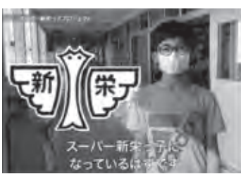
よりよい新栄小学校にしていこう！