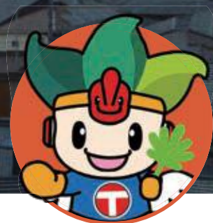
ちくうじん 地空人くん

早朝、役場庁舎屋上から望む日の出です。 冷たく澄んだ空気の中、朝日が本町をあたたかく照らしました。