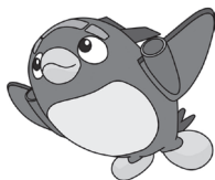
県営名古屋空港 マスコットキャラクター なごびよん

※今後の状況によりイベントの変更・中止の可能性が あるため、ミニギャラリーの最新の情報は、名古屋 空港ホームページをご確認ください。 ( https://nagoya-airport.jp/ )