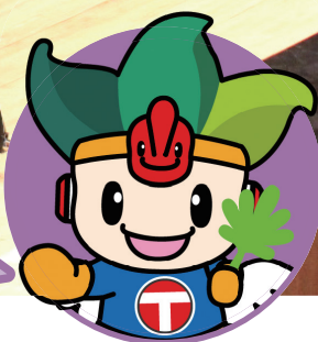
ちくろじん 地空人くん

オミクロン株に対しても基本的な感染対策が有効です。ワクチン接種後も「マスクの着用」や「手洗い」、「3密回避」、「換気」など基本的な感染対策を徹底し、感染拡大防止にご協力をお願いします。