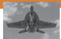
【第3回 フォトコンテスト最優秀賞「滑走路」】