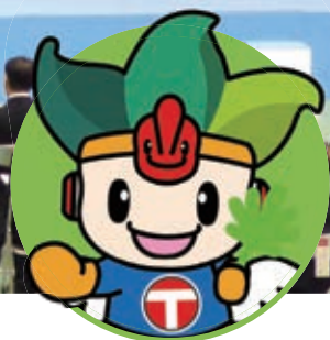
ちくうじん 地空人くん

4月24日(日)、社会教育センターで町制施行50周年記念式典を開催しました。 町に貢献された方々に感謝の意を伝えるとともに、様々な演目が式典を盛り上げました。