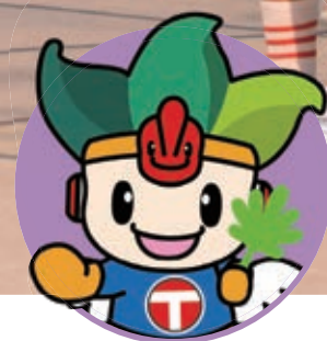
ちくじん 地空人くん

7月24日、社会教育センターで協働フォーラム「とよやまの森」を開催しました。 参加団体がそれぞれの活動を披露し、会場を盛り上げました。