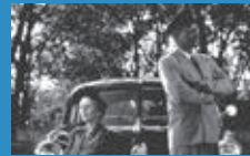
「ドライビングMissデイズ」 (c) 1989 - DRIVING MISS DAISY PRODUCTIONS

上映時間は各作品とも午前中1回の上映を予定。詳細は劇場ホームページにてご確認ください。