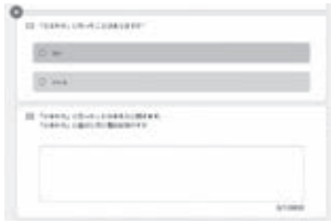
【ロイノートを使ったアンケート】

児童会役員が代表として参加するにあたり、学校外での遊びを中心に豊山町の未来について考えることにし、役員五名で議会の質問事項を話し合いました。さらに、志水小の代表として参加するためには、みんなの思いを聞くことが大切であると考え、児童館や公園での遊びについて全部で八問の質問を作成しました。そして、アンケートはタブレット端末のアプリ「ロイノート」を使って行うことにしました。役員による代表委員会での提案後、四年生以上の学級では代表委員が説明をし、それぞれタブレット端末を使い回答しました。