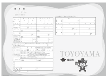
▲オリジナル婚姻届