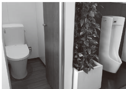
▲社教センター トイレ