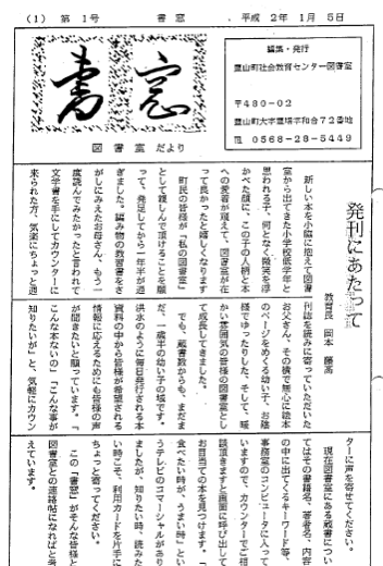
書窓第1号（平成2年1月）

最後に、町図書室では、毎月図書室だより「書窓」を発行しています。平成2年1月に「書窓」第1号が発行されてから、今号で第400号を迎えました。「書窓」の文字デザインやレイアウトは第1号から変化はしましたが、図書の魅力を発信したいという思いは今でも変わりはありません。これからも「書窓」を通して図書の魅力を発信し続けてまいりますので、ぜひ町図書室に足をお運びください。