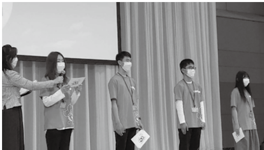
記念事業の司会を務めたジュニアリーダー