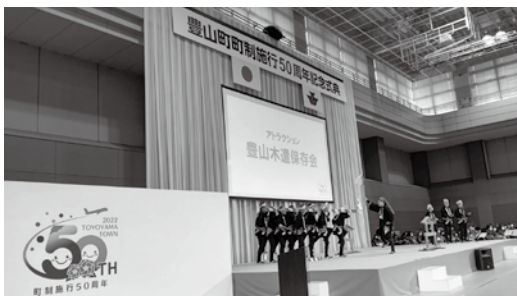
豊山木遣保存会のアトラクション