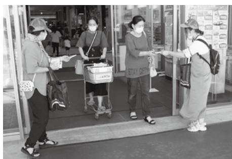
青少年の非行・被害防止

町では、毎年、青少年育成会議の参加団体が、啓発運動や町内巡回をしてこの運動に参加します。