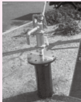
防災井戸のイメージ